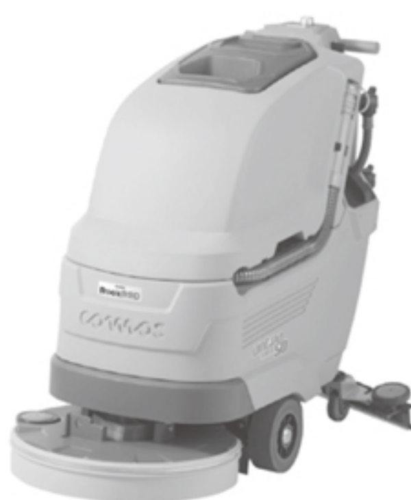
①20インチディスクタイプ (Antea 50BT)