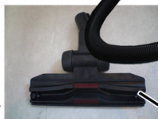
① 新型床ノズル部 (底面)