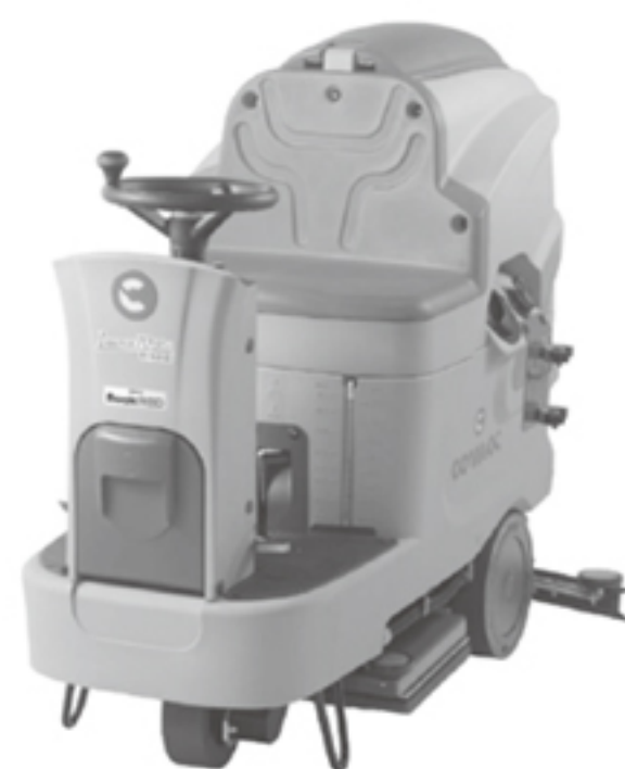
④28インチ振動式搭載型 (Innova 70BTO)