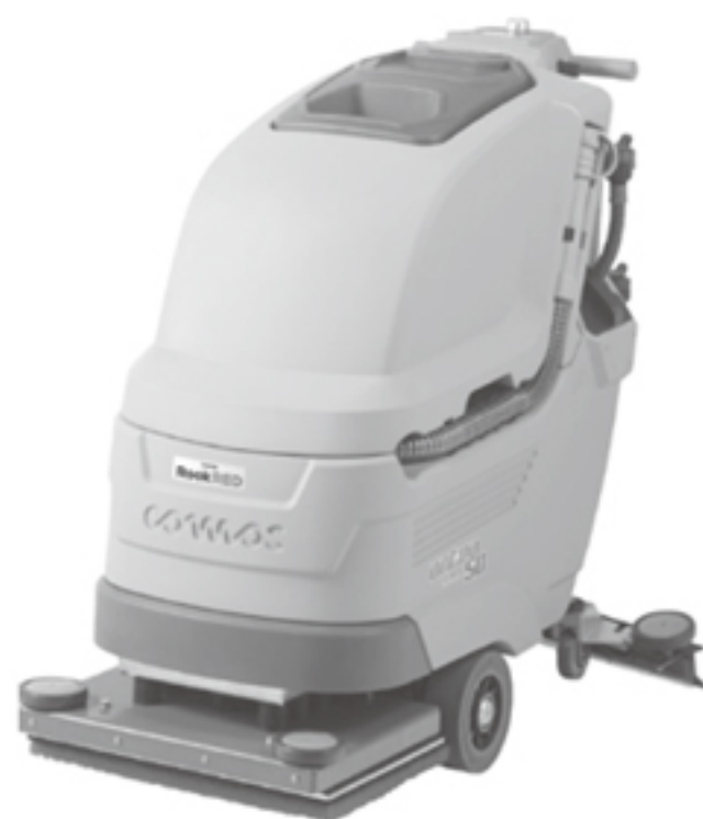
②20インチスクエアタイプ (Antea 50BTO)