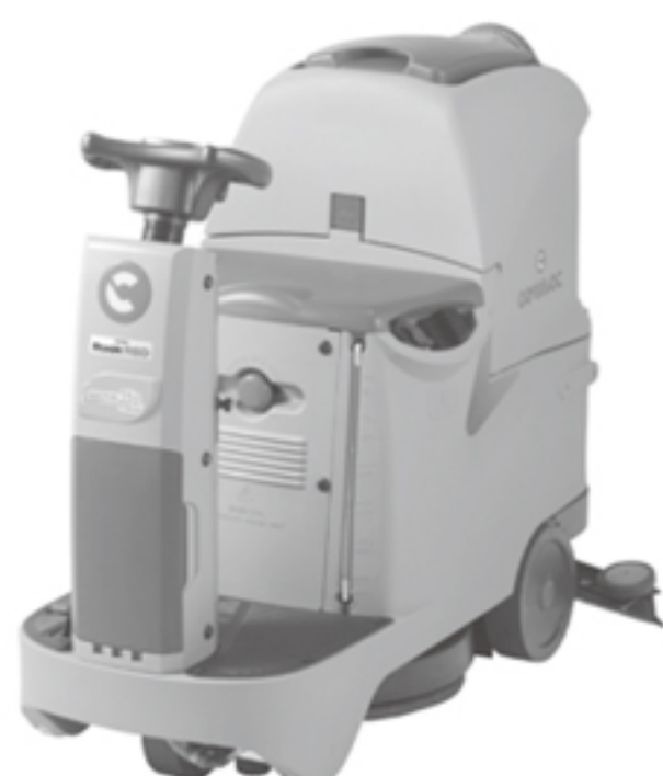
③22インチディスク式搭載型 (Innova 55B)