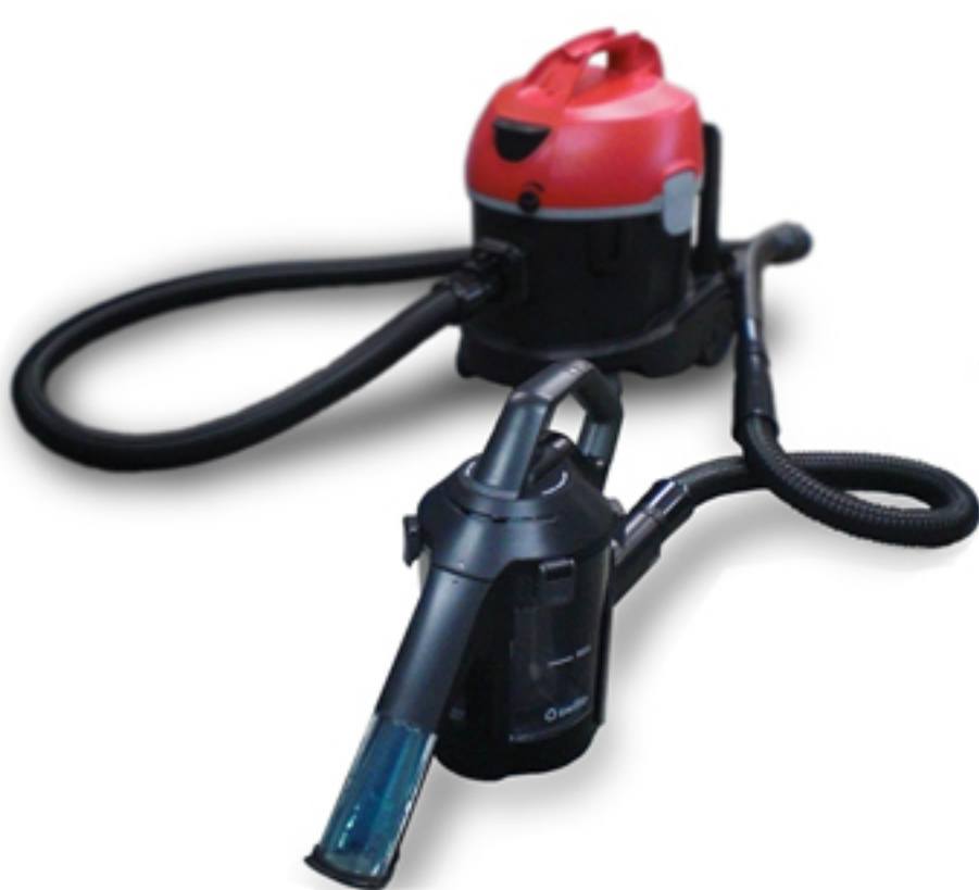
スイトルにホ-P'S-II 装着例

このスイトルは本当に様々なシーンで使い頂けると思います。カーペットや畳の上での飲みこぼしや食べこぼしの際はもちろんの事、清水タンクに除菌剤等を入れ、ペットのおしっこ・人の嘔吐物などの処理にご利用頂けるのではと考えます。まだ発売され間もない商品ですので、色々な使用用途が見つかると思います。皆様からの成功事例などは是非ご教示ください。弊社に於きましては、皆様の貴重な情報を共有し、全国の困っているお客様が喜んで頂けるよう努めて参りますのでよろしくお願いいたします。