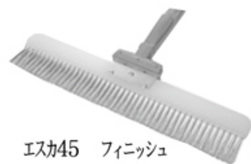
Eスカ45 フィニッシュ